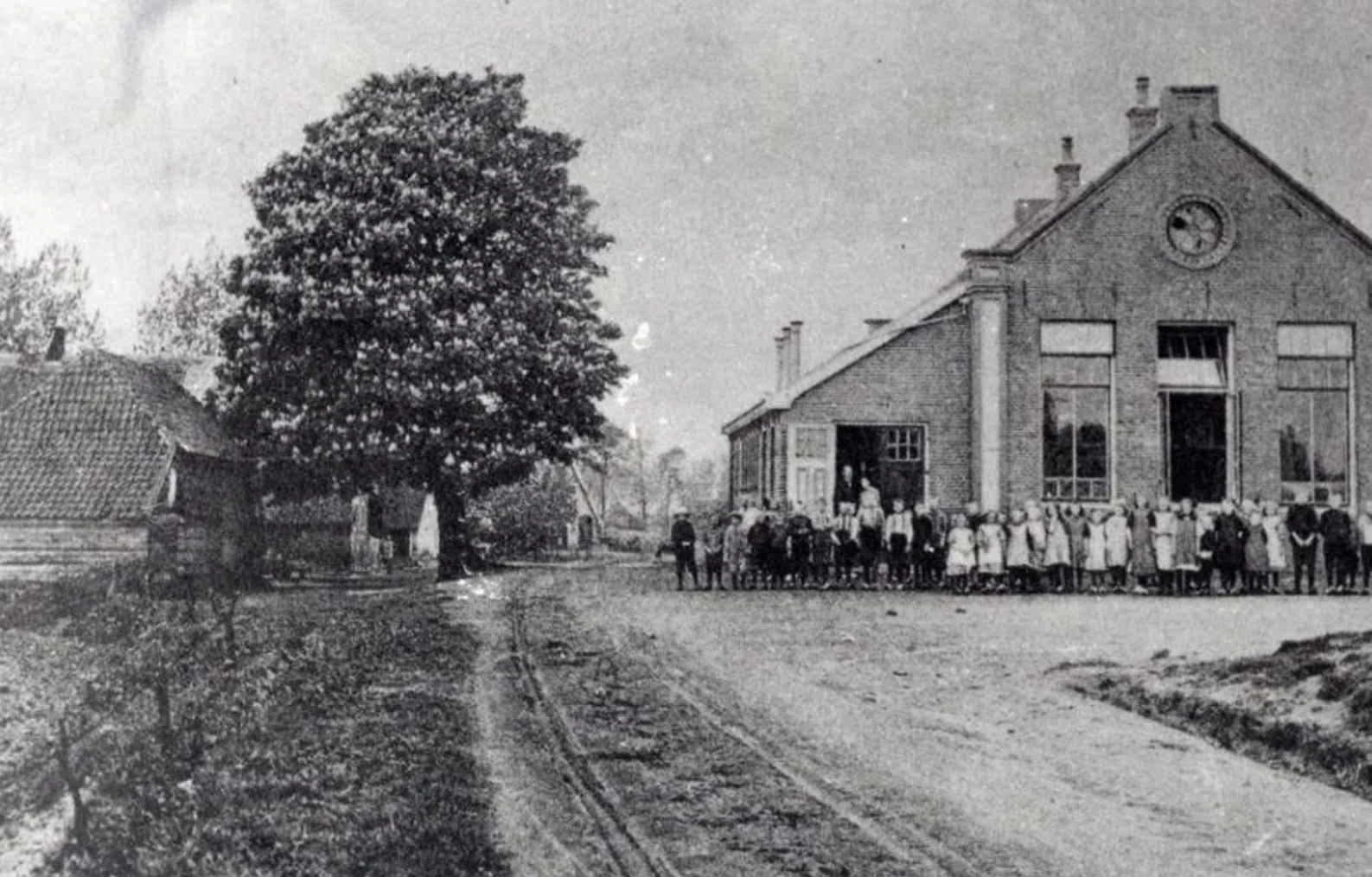
Oud-Lutten 1875 Schooltje op de hoek